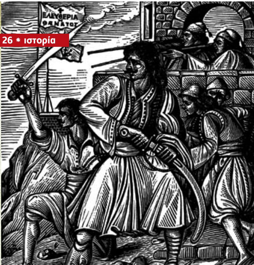
Ξυλογραφία του Α. Τάσσου, εμπνευσμένη απ' την Επανάσταση του 1821.

κινηθεί ως τώρα. Από τις μορφές ανάπτυξης των παραγωγικών δυνάμεων οι σχέσεις αυτές μεταβάλλονται σε δεσμά τους. Τότε έρχεται μια εποχή κοινωνικής επανάστασης».